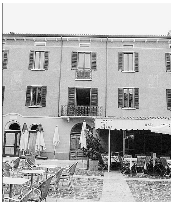
e. s. Palazzo Callas ospiterà il 10 giugno la mostra «Fashionset»