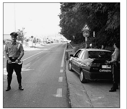
Un posto di controllo dei carabinieri

Le ricerche nella zona ed i posti di blocco effettuati ad ampio raggio non hanno dato esito. I rapinatori sono riusciti a dileguarsi. Ma all'esame degli investigatori dell'Arma sono ora le «tracce» lasciate nella banca e nella videocassetta.