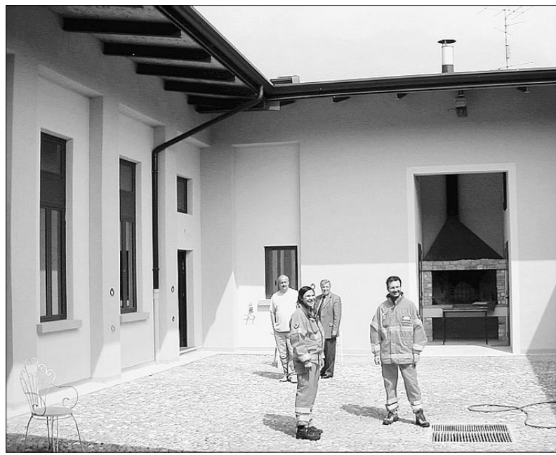
Il presidio sanitario di Toscolano nell'ex macello comunale

Il denaro raccolto tramite gli sponsor che sostengono il progetto sarà infatti destinato alla costruzione di un pozzo di acqua potabile a Kisanani, nella Repubblica del Congo, a cura dell'associazione bresciana «Cuore Amico». Il diario dell'iniziativa è consultabile sul sito www.acquavventura.it .